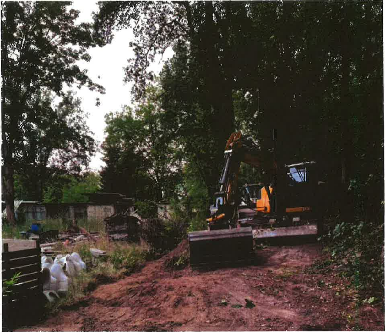
7 juli 2022 kaapen van bomen en rooien van struiken langs bospad naast Landgoed Leudal