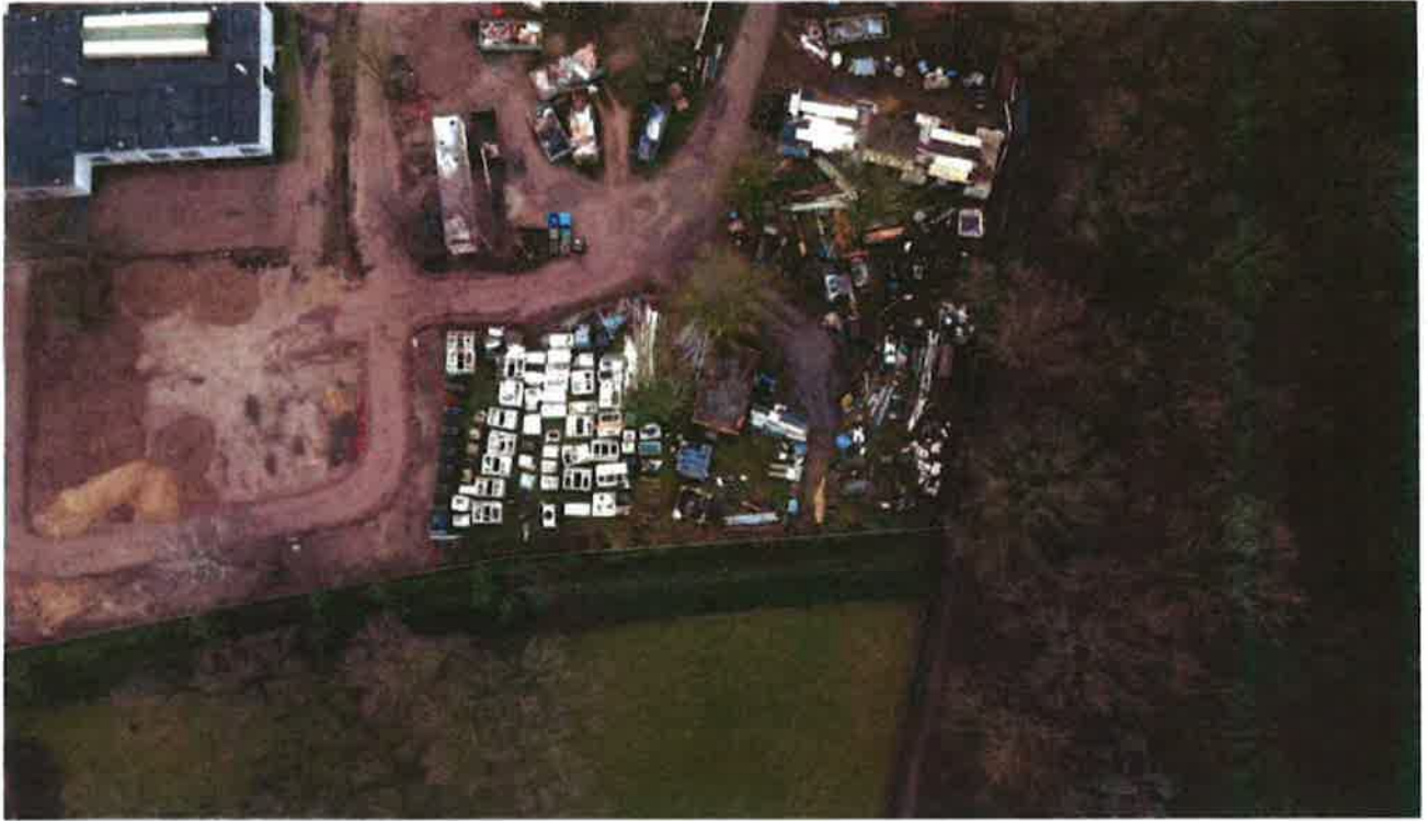
Situatie 21-12-2021 duidelijk de intensieve begroeiing te zien langs het bospad