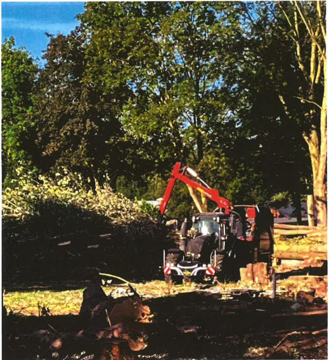
15 juli 2022 takken worden versnipperd en afgevoerd en worden de boombroeken uitgegegraven