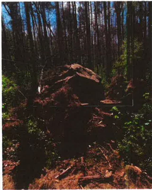
19 augustus 2022 Boombroeken verwijderd en gedumpt in natuurgebied