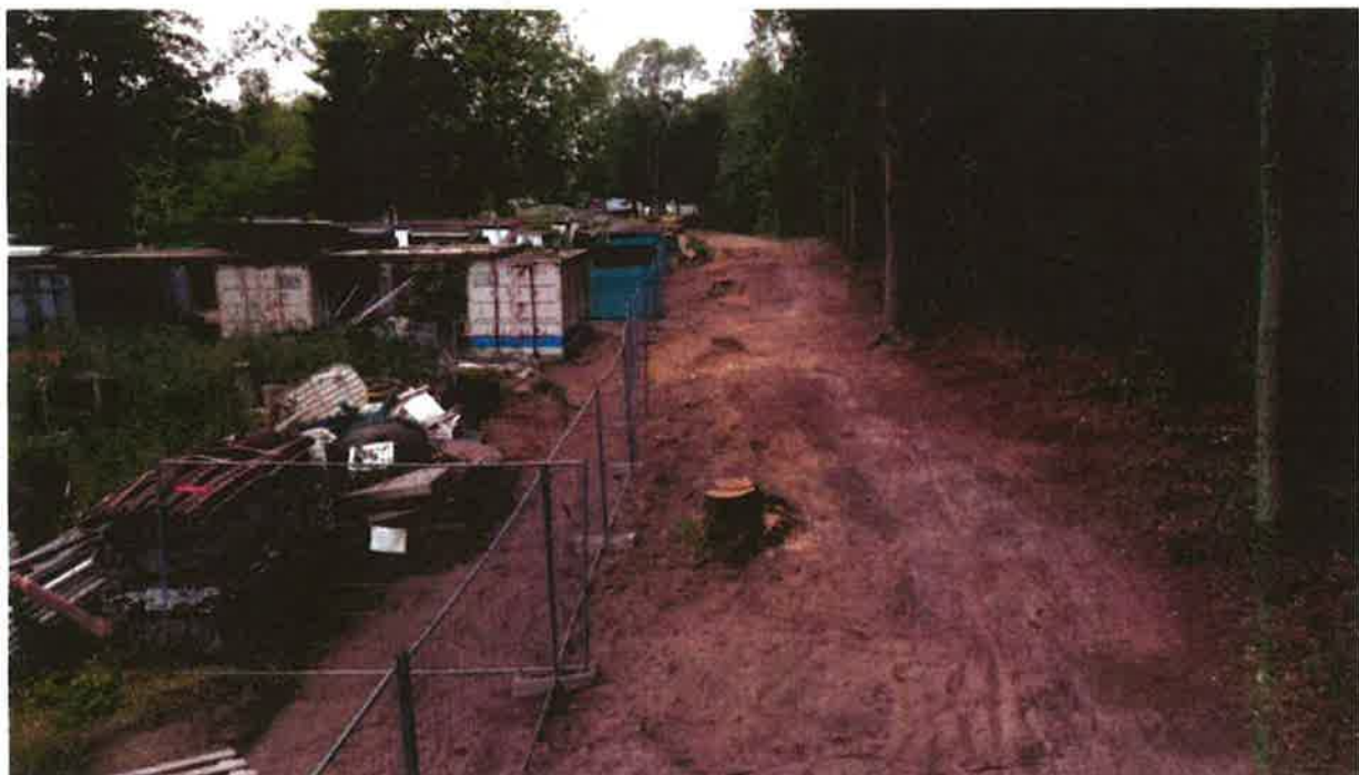
3 juli 2022 bomen en struiken zijn verwijderd